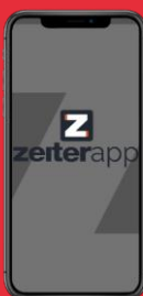
Dispositivos Móviles IOS o Android ZeiterAPP