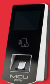
Dispositivos Físicos ZEITER MCU