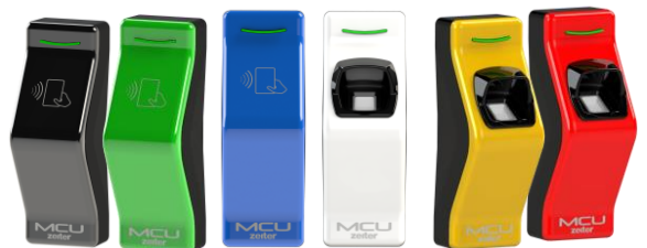
ZEITER MCU Access Control Wave