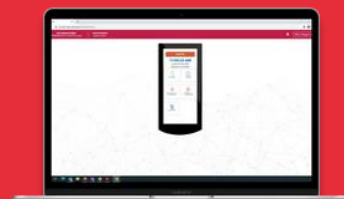
Dispositivos Virtuales Zeiter Virtual